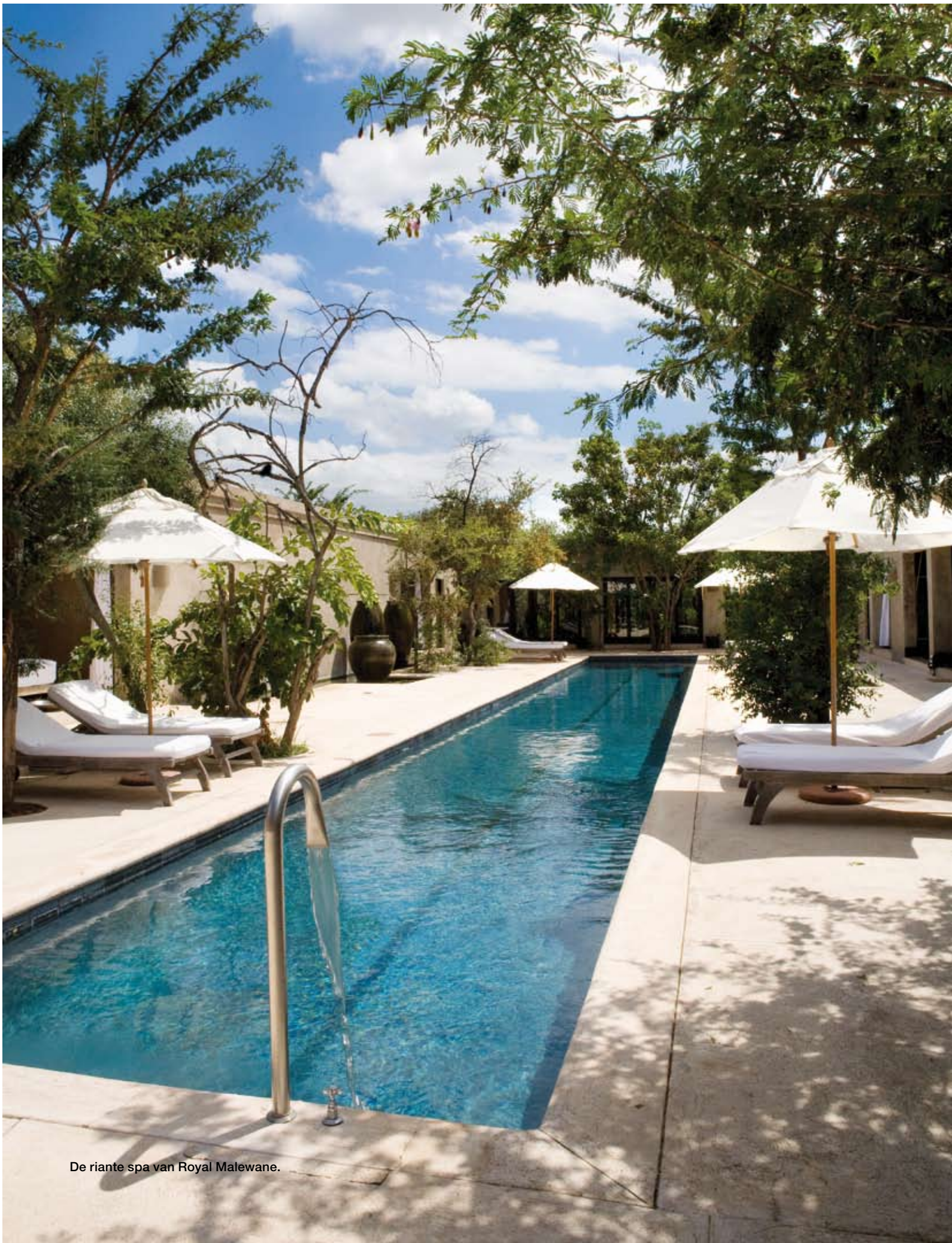
De riante spa van Royal Malewane.