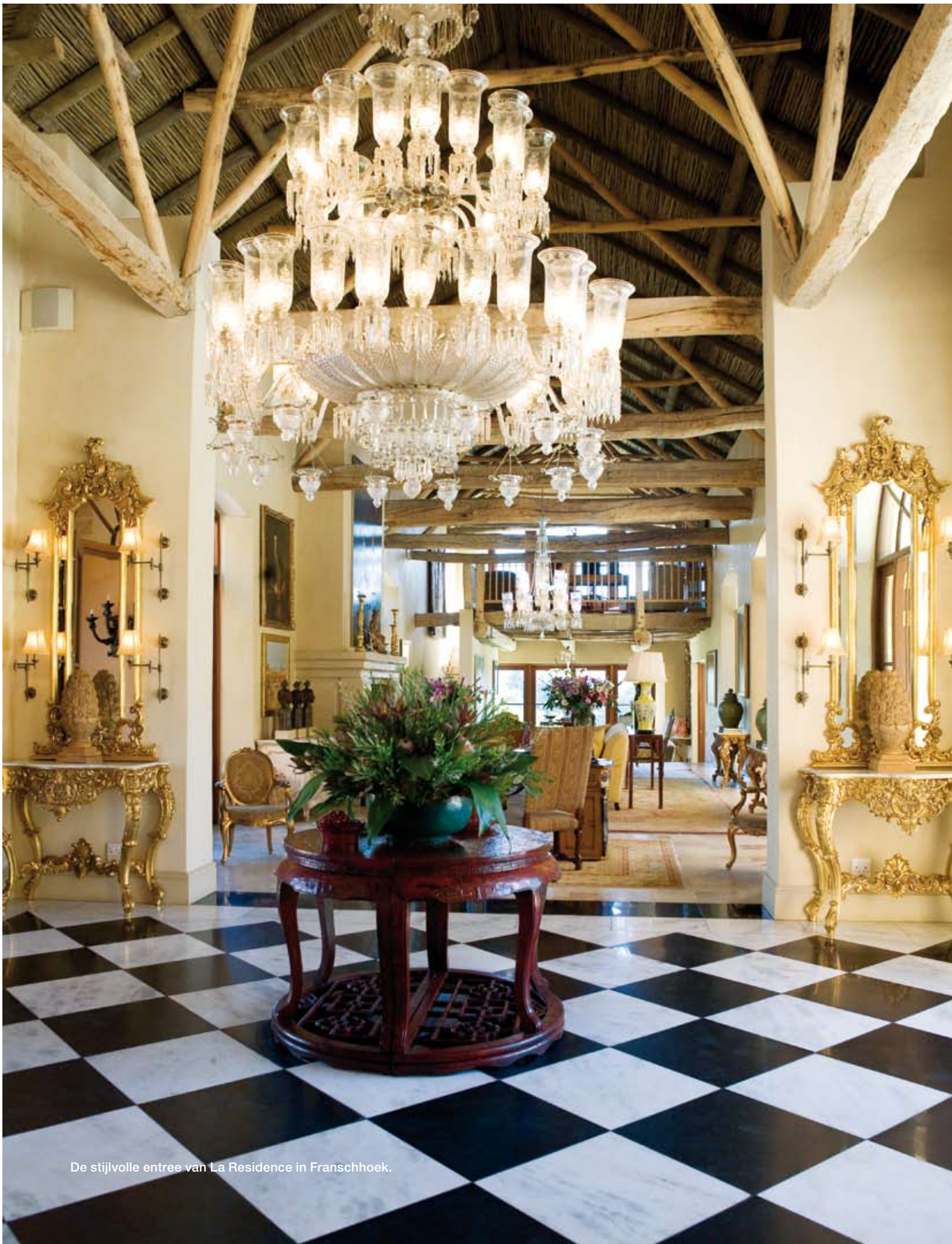
De stijlvolle entree van La Residence in Franschhoek.