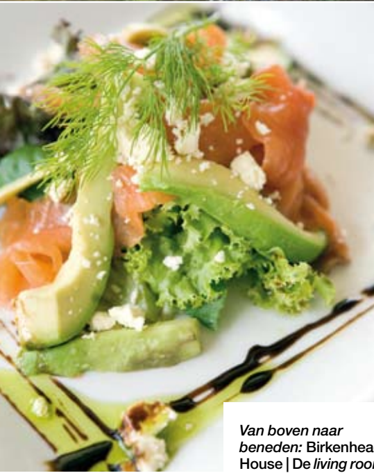
Van boven naar beneden: Birkenhead House | De living room | Avocado-zalmsalade als lunchgerecht | Scenic flight boven Hermanus | Walvissen vanuit de lucht.